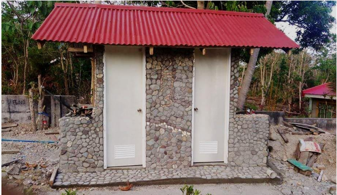
Kito Health Center a San Francisco, Isole Camotes